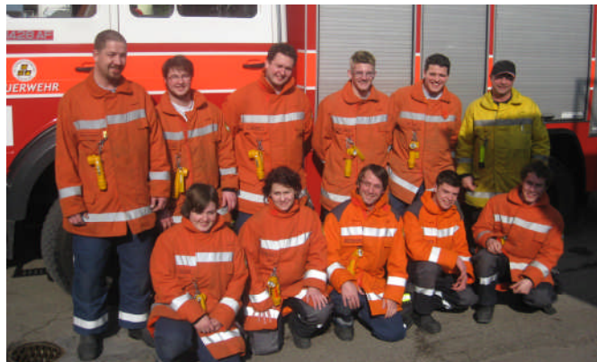
Ein Teil der neuen AdF am Einführungskurs in Uzwil