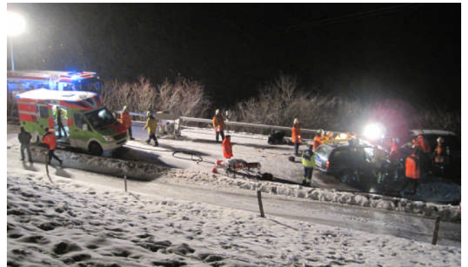
Unfall-Situation aus Distanz gesehen

Ausgangslage: Auf vereister Fahrbahn sind zwei Personenwagen frontal miteinander kollidiert. In einem der beiden Fahrzeuge ist der Lenker eingeklemmt. Die Anfahrt zum Einsatzort gestaltet sich infolge der vereisten Strassen schwierig. Rettungsdienst und Polizei sind vor Ort.