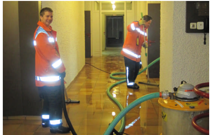
Motivierte AdF im Einsatz

Massnahmen: Die zuständige Wasserkorporation wird aufgebieten, welche die Hauptleitung schliesst. Mit mehreren Tauchpumpen und dem Einsatz von Wassersaugern wird das eingedrungene Wasser im Untergeschoss der Turnhalle abgepumpt. Für die Entfeuchtung des Gebäudes werden externe Luftentfeuchter organisiert und installiert.