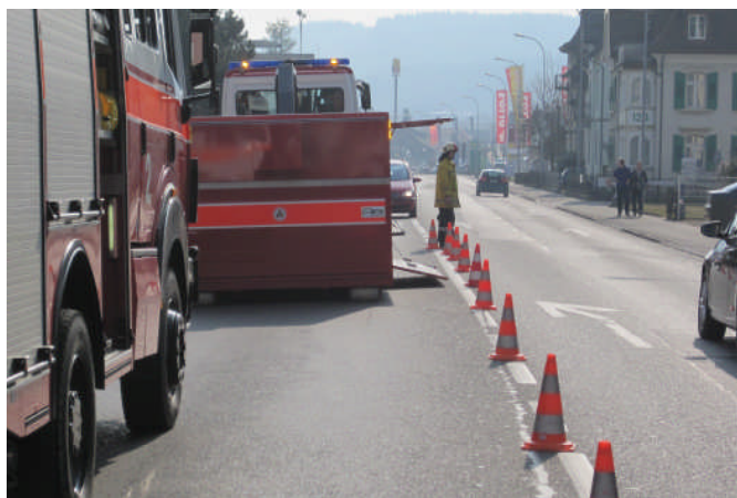
Der Einsatz erfordert eine Einbahnverkehrsführung

Sonntag, 13. Februar 2011, 1202 Uhr, FW Wil Rauch aus Backofen Toggenburgerstr. 113 bei Baralija, Alst.-1