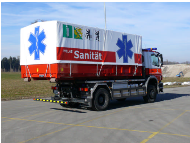
Der neue WELAB Sanität auf dem Trägerfahrzeug G7

Die vier Kantone St. Gallen, Thurgau und beide Appenzell haben zusammen das ehemalige Einsatzmittel des Militärs, den WELAB 9 nach Ausserbetriebnahme durch die Armee gekauft. Nach umfassendem Umbau ist er seit Ende Februar 2011 als WELAB Sanität wieder vollumfänglich einsatzbereit. Neues Material wurde nach den Bedürfnissen des Rettungsdienstes beschafft. Zusammen mit dem Sanitäts-Container bilden die beiden Mittel wieder die Grundlage für den Aufbau der Sanitäts-Hilfsstelle. Die offizielle Übernahme des WELAB Sanität erfolgt am 5. Mai 2011.