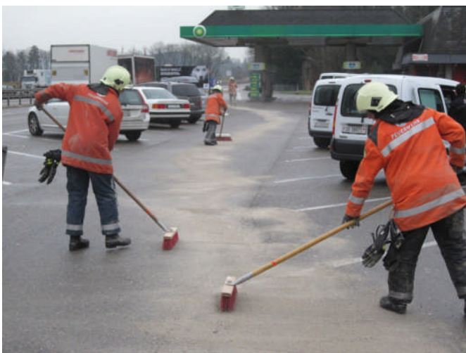
Bindemittelleinsatz auf der Raststätte Thurau

Montag, 10. Januar 2011, 1005 Uhr: FW Wil, Oelspur, Einfahrt A1 Richtung St. Gallen, Alst 0.2