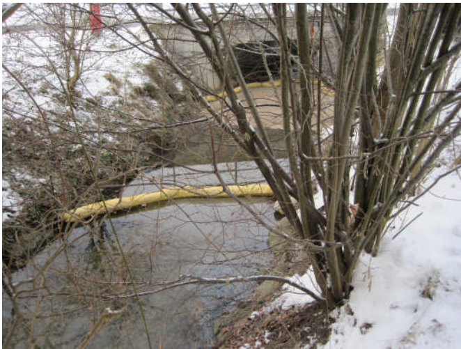
Die Ölsperre in Trungen

Ausgangslage: Auf dem Betriebsgelände der Härterei Bronschhofen ist ein ausgedienter Transformator umgekippt. Dabei ist eine unbestimmte Menge Öl auf dem Platz ausgelaufen. Ein Teil davon ist über einen Metoschacht in den nahe gelegenen Bach gelangt.