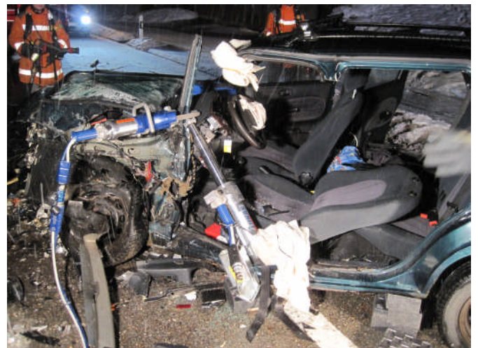
Zusammenspiel von Schere und Zylinder

Massnahmen: In Absprache mit der Polizei wird die Strecke gesperrt und der Verkehr umgeleitet. Die eingeklemmte Person wird durch den Rettungsdienst mit unserer Unterstützung betreut. Mit Handfeuerlöscher und dem Schnellangriff wird der Brandschutz sicher gestellt. Nachdem die Stromversorgung gekappt und das Fahrzeug unterbaut ist, wird mit hydraulischem Werkzeug die Fahrertüre entfernt und die A-Säule mittels Zylinder nach vorne gedrückt. Als Anschlagpunkt für den Zylinder wird die hydraulische Schere an der A-Säule fixiert. In der Folge kann der Patient mit dem Rettungsbrett durch die seitliche Öffnung aus dem Fahrzeug gerettet und dem Rettungsdienst für die weitere Versorgung übergeben werden.