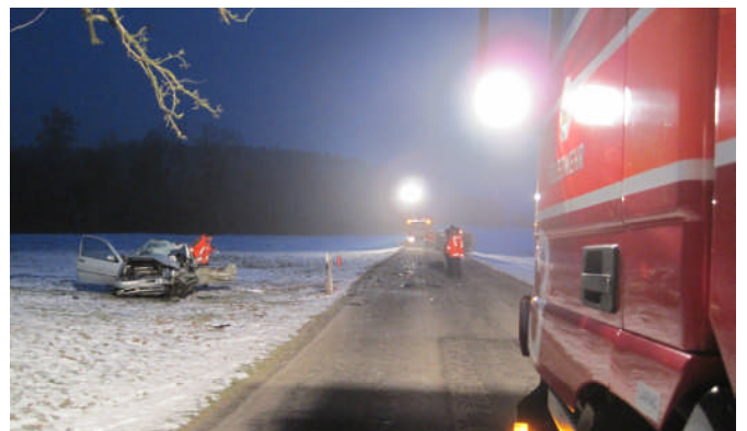
Mit TLF und RW wird der Schadenplatz ausgeleuchtet

Ausgangslage: Nach der Frontalkollision zwischen einem Personenwagen und einem Transporter auf der Überlandstrasse in Niederhelfenschwil ist die Personwagenlenkerin schwerverletzt eingeklemmt und muss reanimiert werden. Die Polizei ist vor Ort. Der Rettungsdienst trifft gleichzeitig mit dem Kommandowagen G8 auf dem Schadenplatz ein.