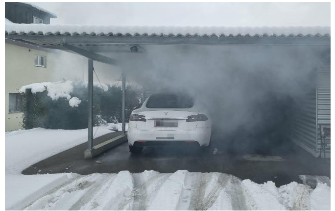
Brände von Elektrofahrzeugen häufen sich.

ist Höhe rechtem Hinterrad ersichtlich. Ein ätzender Geruch verbreitet sich schnell.