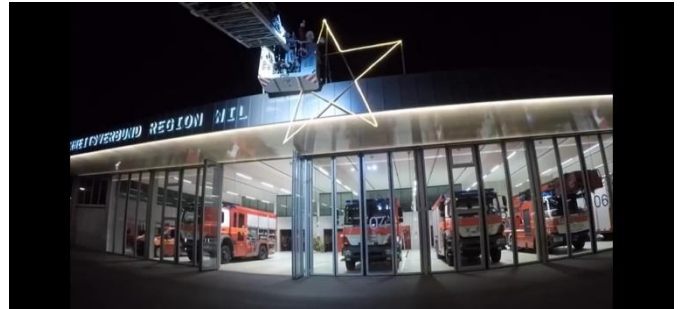
Ausschnitt aus dem Weihnachtsvideo 2021 des SVRW

Auch in der vergangenen Weihnachtszeit wurde wieder ein Weihnachtsvideo online gestellt und fleissig geliked und geteilt – Besten Dank dafür! 😊