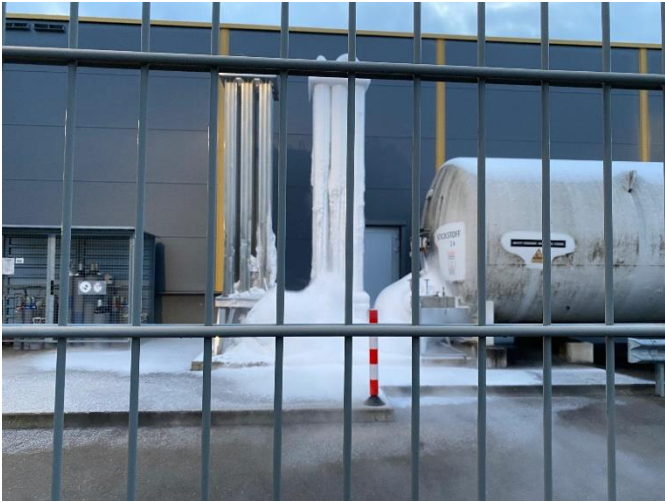
Vereister Stickstofftank – normales Verhalten

Ausgangslage: Vereister Stickstofftank verursacht Nebelbildung über der Strasse. Der Anrufer ist nicht vor Ort.