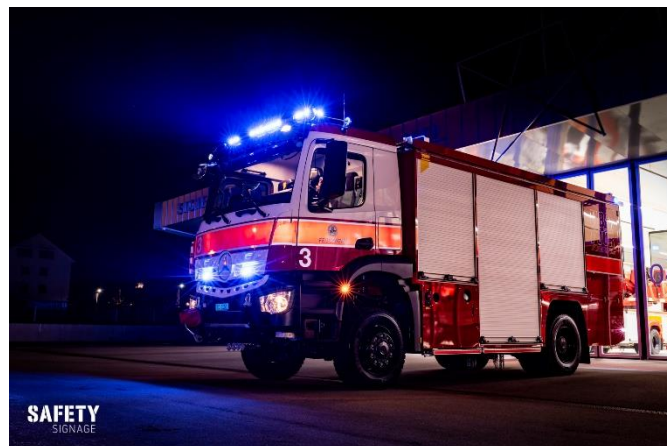
Der neue G3 in beste Szene gesetzt (Bild: Safety Signage)

Ich bedanke mich bei der Arbeitsgruppe und den beteiligten Firmen für Ihre wertvolle und gute Arbeit.