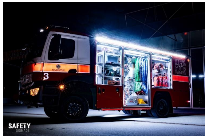
Gut aufgeräumt im Innern

Bau des neuen G3 durch die Arbeitsgruppe begleitet und an diversen Sitzungen mit dem Hersteller die verschiedenen Produktionsschritte besprochen.