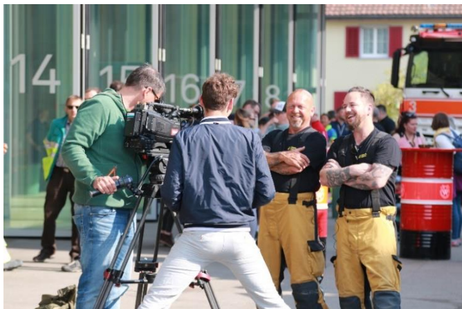
Büetzer Buebe im Interview

Das Event war ein voller Erfolg für alle involvierten Parteien. Über den ganzen Abend gab es sehr viele Besucher. Die Büetzer Buebe sorgten für eine gute Stimmung und verteilten Autogramme für alle. Auch die Festwirtschaft lief sehr gut für den Feuerwehrverein.