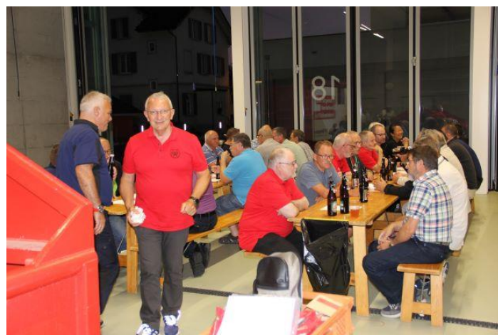
Den Abend unter den Kameraden ausklingen lassen

Anschliessend gewährte die Kp 3 einen Einblick in die moderne Einsatzzentrale. Weiter wurde noch die mobile Sanitätshilfsstelle vorgezeigt, welche bei Einsätzen mit grossem Patientenansturm benutzt wird. Zum Schluss konnte bei Wurst und Getränken der Austausch untereinander gepflegt werden.