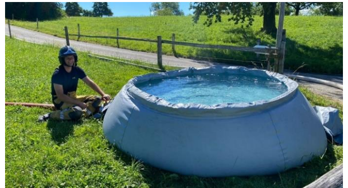
Das schöne Wetter am geniessen!